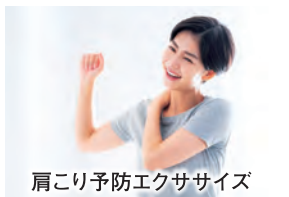
肩こり予防エクササイズ