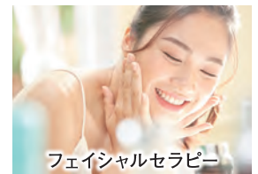
フェイシャルセラピー