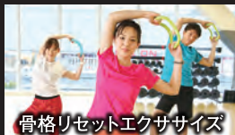
骨格リセットエクササイズ